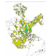
Zonas de Producción